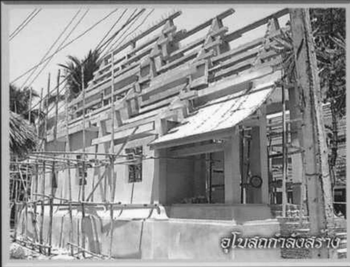
อุโบสถกำลังสร้าง