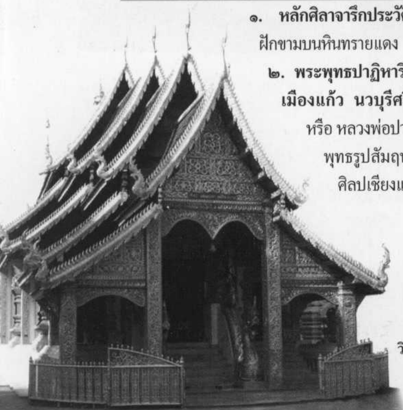
วิหารวัดศรีสุพรรณ