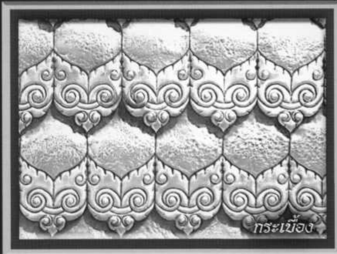
กระเบื้อง